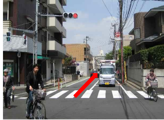
⑤ 東ギンザ通りを抜けると早稲田通り。手前左にローソン。青原寺前駐在所信号を直進。