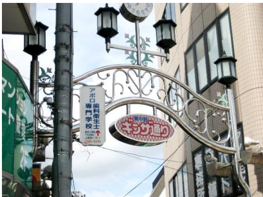
③ 東中野ギンザ通りの入り口にアポロの看板。左角にファミリーマート、牛井の松屋。