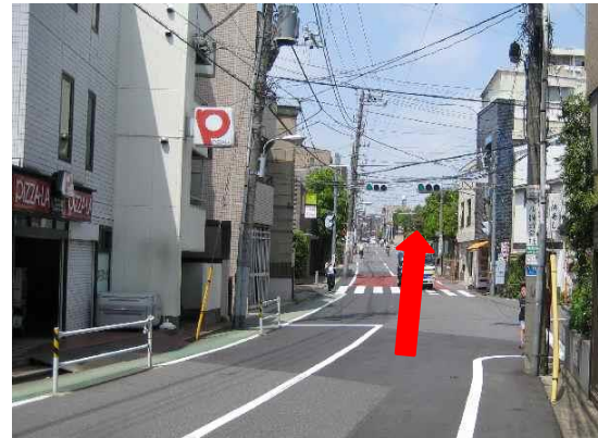
⑥ 坂を下りきったところに上高田1丁目信号。直進します。