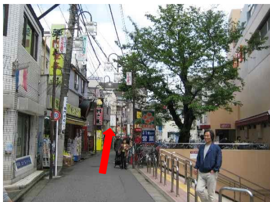
④ 東中野ギンザ通りの途中右手にライフ。そのまま直進。