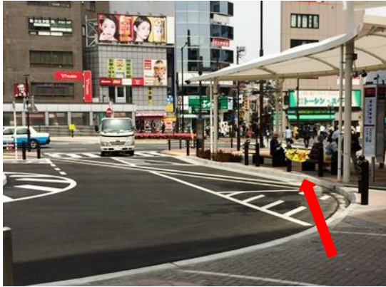
① 西口改札(中野・三鷹寄り)を出て、まっすぐ進みます。ロータリーを右方向に行き、山手通りに出ます。