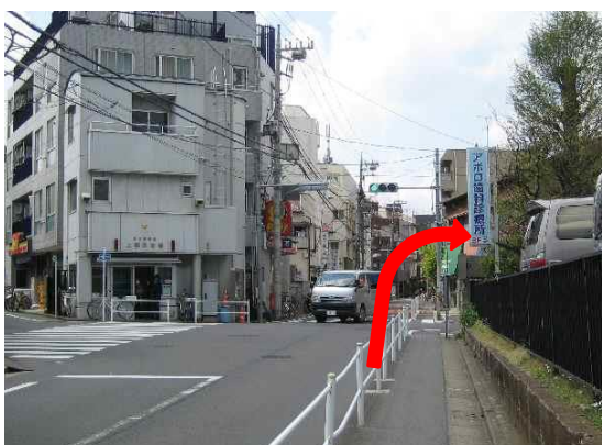
⑧ 正面に上高田交番。右手に「アポロ歯科診療所」の看板。右に曲がって電話ボックスの後ろが学校です。