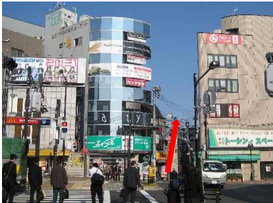
② 山手通りの信号を渡り、東中野ギンザ通り商店街を直進します。